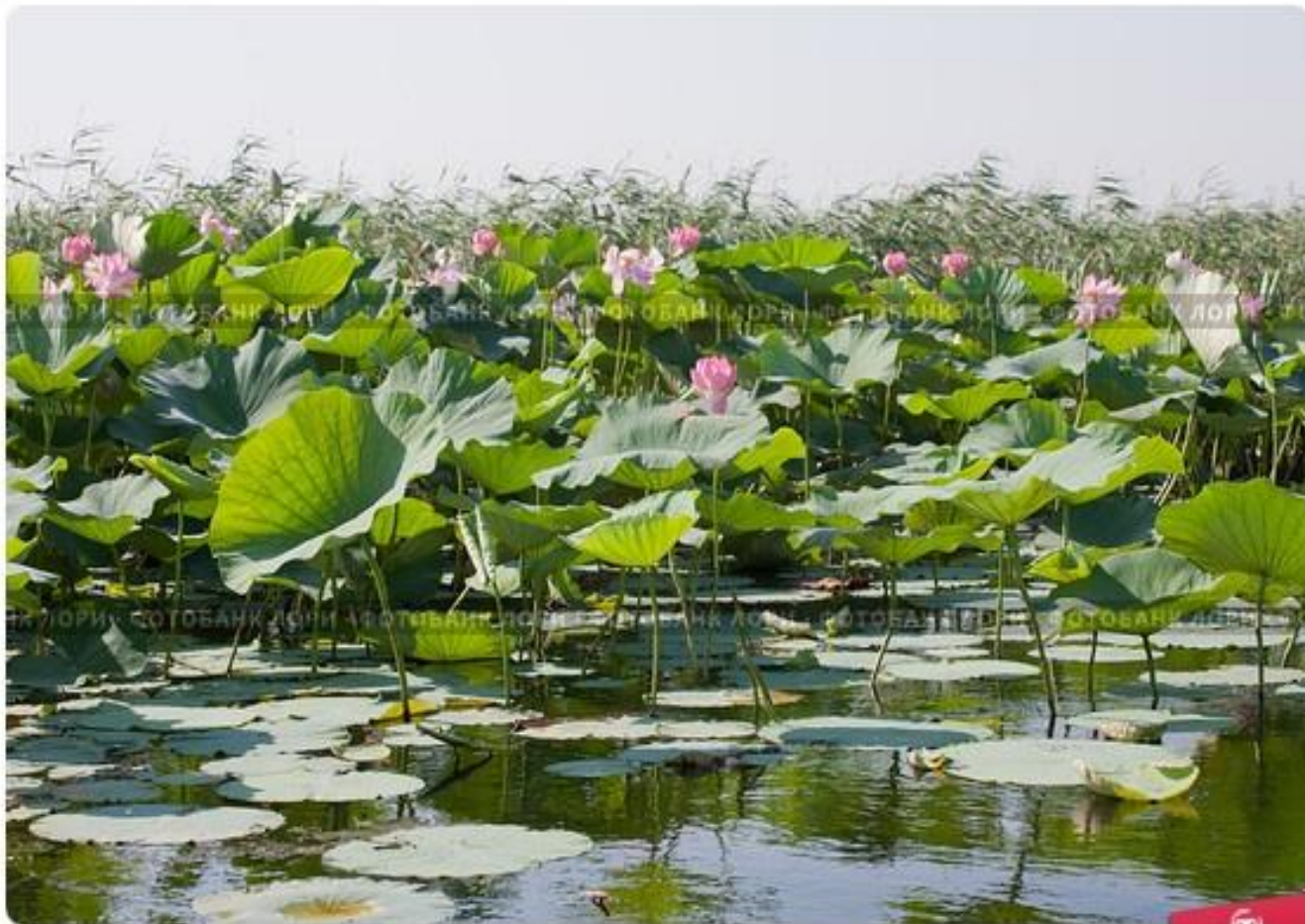
Лотос Комарова или лотос орехоносный ( Nelumbo komarovii , Nelumbo nucifera ). Д