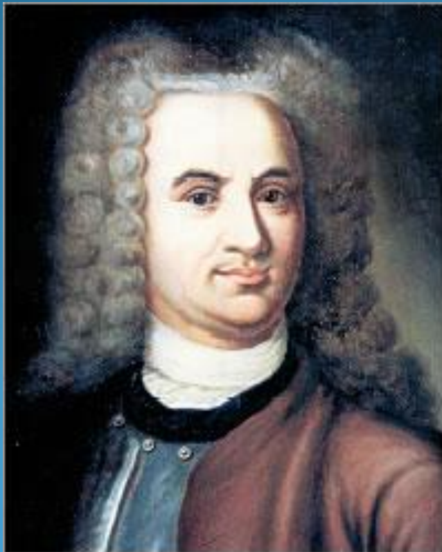
Татищев Василий Никитич