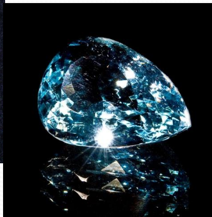
Граненый голубой топаз