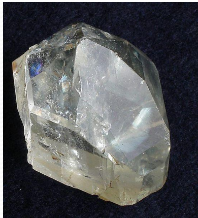
Бесцветный топаз, Минас- Жерайс, Бразилия

Месторождения - Россия (Урал), Украина ( Житомирская область), Бразилия, о. Мадагаскар.