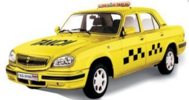
т а кси