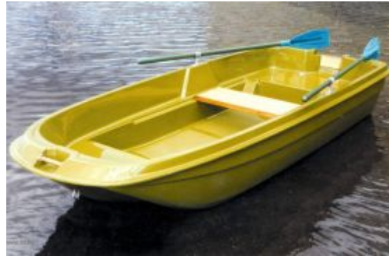
ло д ка