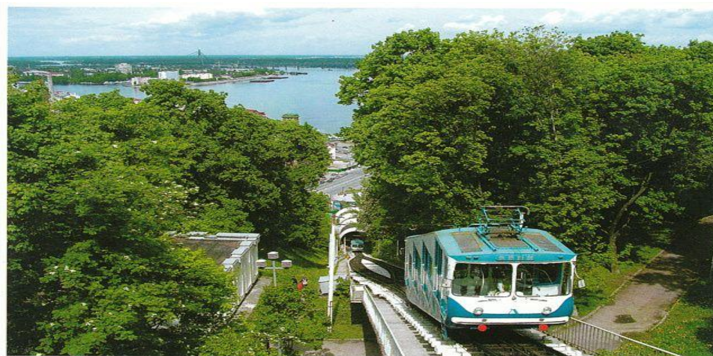
ГОРНЫЙ ТРАМВАЙ-ФУНИКУЛЕР / MOUNTAIN TRAM-CABLE RAILWAY CAR OPERATES