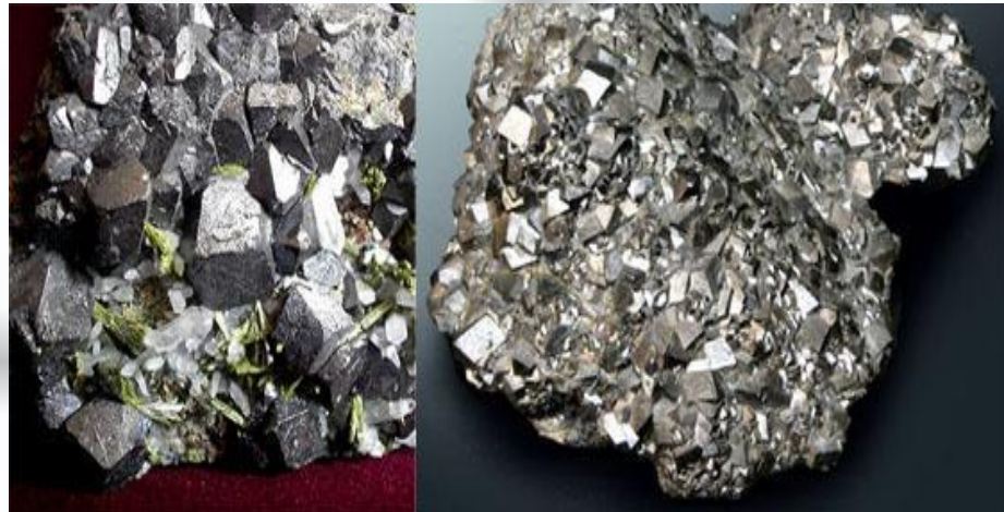
Минерал магнетит с окисями железа