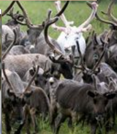
Полярная олени сова