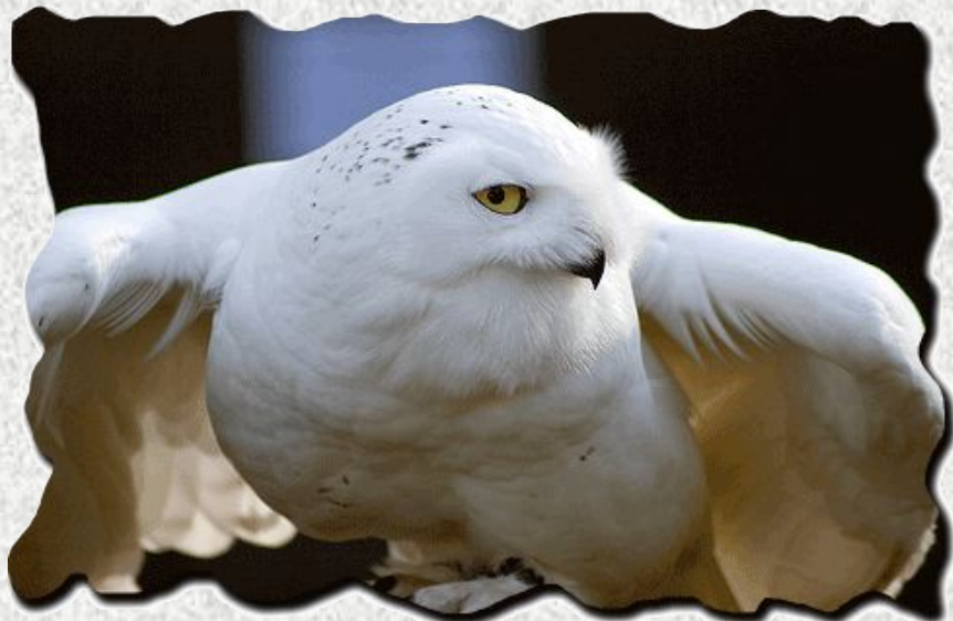
Полярная (белая) сова