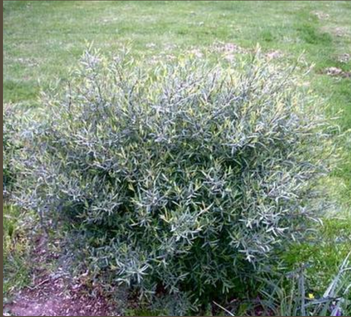
Карликовая я ива