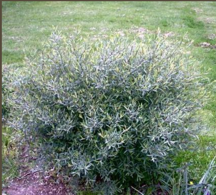
Карликовая я ива