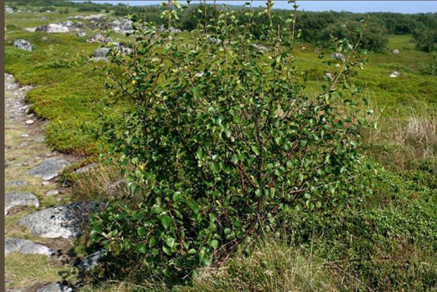
Карликовая я берёза

У ЭТИХ растений короткие стебли и мелкие листочки