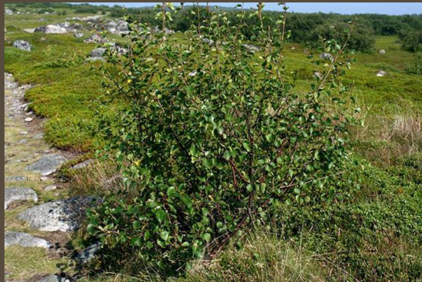
Карликовая я берёза

У ЭТИХ растений короткие стебли и мелкие листочки