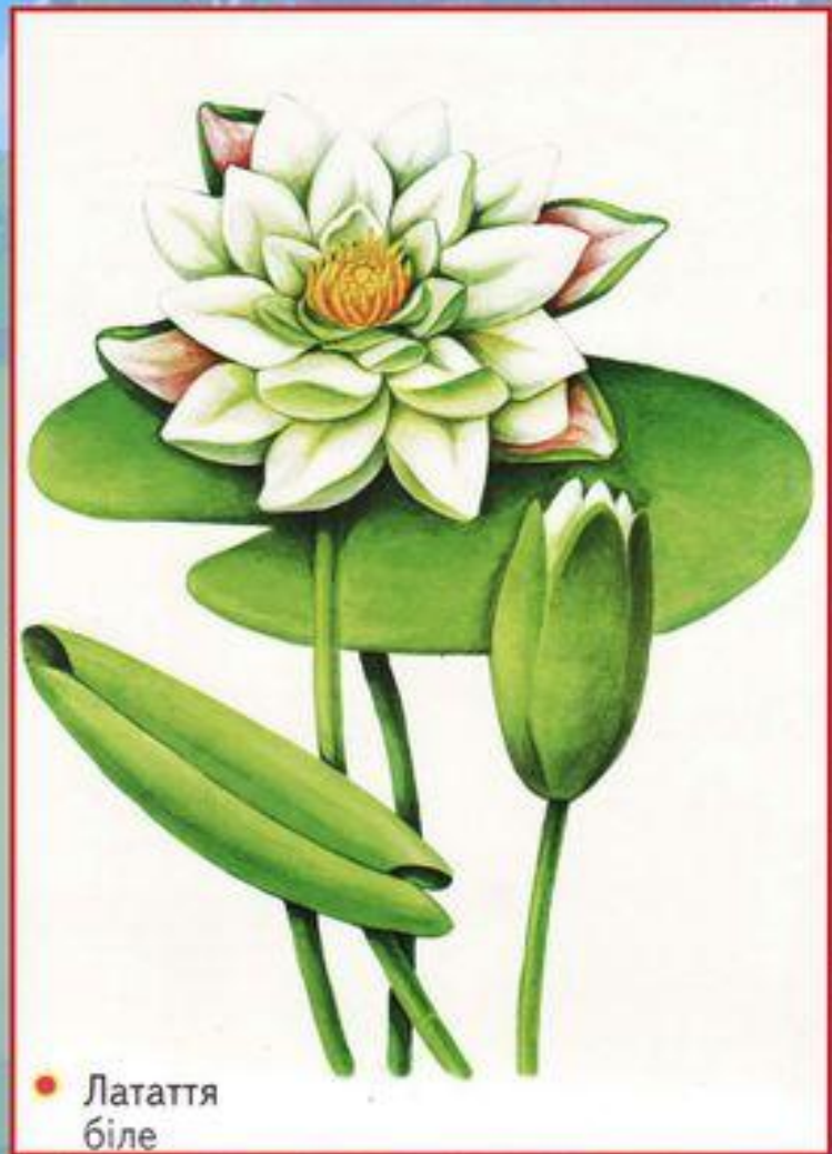
● Латаття біле

Слід зазначити, що в останні роки ці чудові квіти все більше винищуються. Любителі наживи заготовляють величезні оберемки квітів латаття для продажу їх у місцях масового літнього відпочинку. Тому ця чудова водяна рослина потребує охорони.