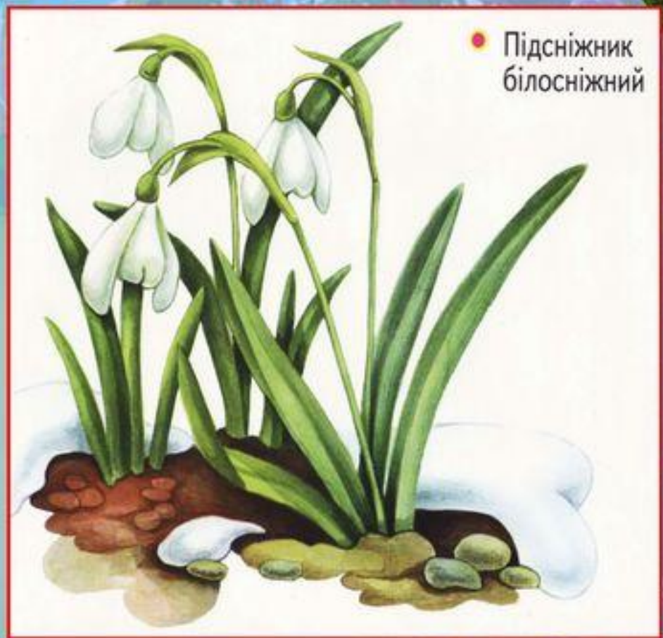
● Підсніжник білосніжний

Завдяки своїй красі та першоцвіту у весняному квітковому карнавалі, підсніжники і проліски користуються величезним попитом у мешканців міст. Сотні тисяч квіток рвуться на продаж. Таке ніким не контрольоване знищення квітів призводить до сумних наслідків. У багатьох місцевостях, де колись підсніжників і пролісків було дуже багато, вони зникають або вже зовсім зникли. Охороняється в Карпатському біосферному заповіднику; у природних заповідниках Розточчя, Медобори, Горгани і Канівський; у національних природних парках Карпатський, Синевир та Сколівські Бескиди; в деяких заказниках.