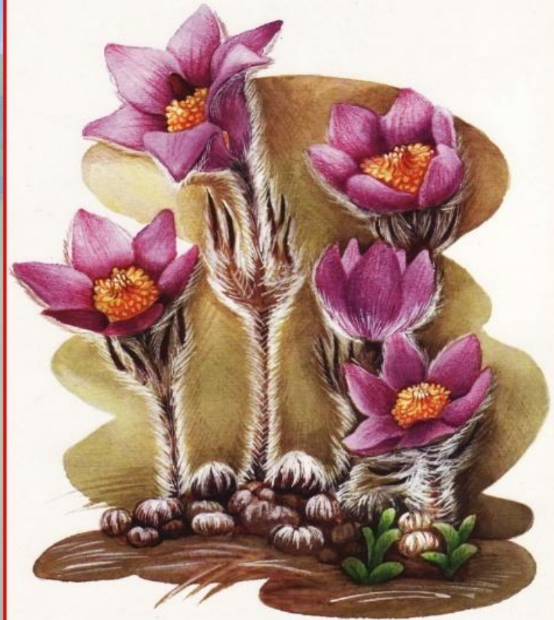
● Сон великий

Поширений на Подільській височині та подекуди в лісостепу. Охороняється в природному заповіднику Медобори; в заказниках: Жижавський і Обіжівський (Тернопільська обл.), Циківський і Панівецька Дача (Хмельницька обл.)