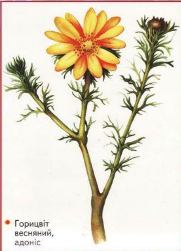
● Горицвіт весняний, адоніс

Горицвіт – важлива лікарська рослина, чудова декоративна рослина і гарний медонос. Поновлюється дуже поволі. З насіння розвивається протягом десяти і більше років! Потреба у сировині цієї лікарської рослини величезна, а природні запаси її, внаслідок надмірної заготівлі, значно зменшилися. Тому горицвіт розводять на спеціальних плантаціях.