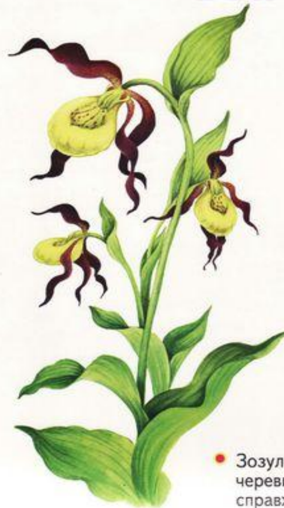
● Зозулині черевички справжні

Охороняється в природних заповідниках: Кримському і Медобори, у Шацькому та Карпатському національних природних парках, у заказнику Совий Яр. Вирощується у Національному ботанічному саду.