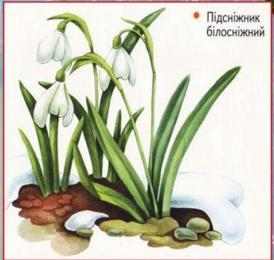
● Підсніжник білосніжний

Охороняється в Карпатському біосферному заповіднику; у природних заповідниках Розточчя, Медобори, Горгани і Канівський; у національних природних парках Карпатський, Синевир та Сколівські Бескиди; в деяких заказниках.