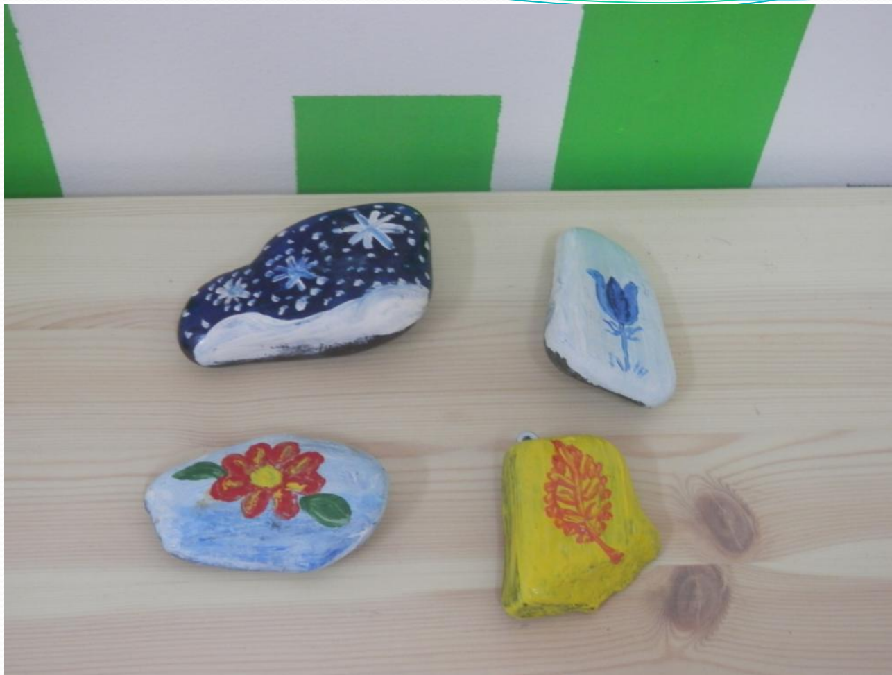
«Времена года». Материал: Камень, гуашь, лак. Ознакомление с окружающим миром.