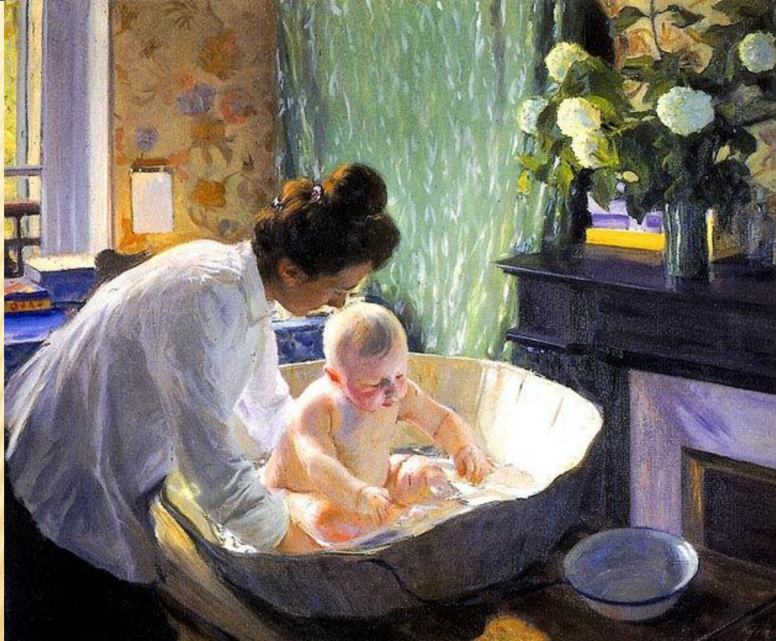
Б. М. Кустодиев