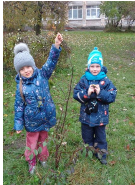
октябрь 2017 г.