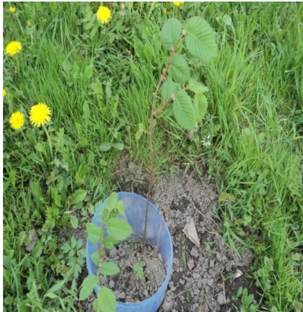
Посадка молодого вяза май 2016 г.