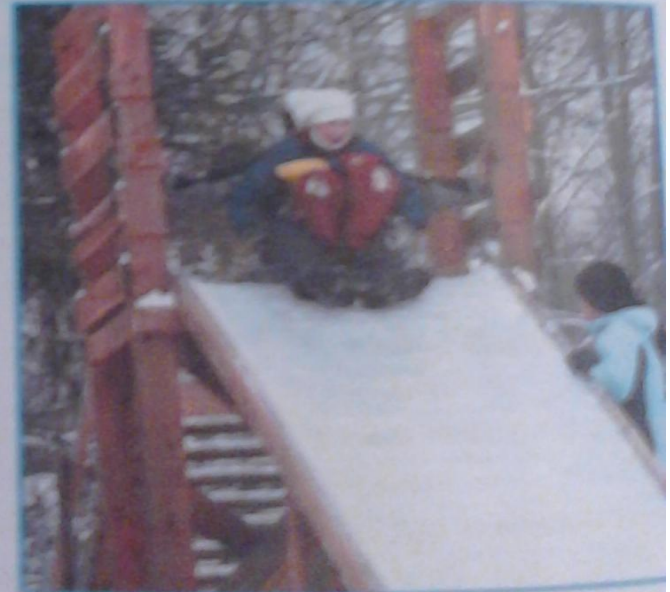
Право на отдых и досуг