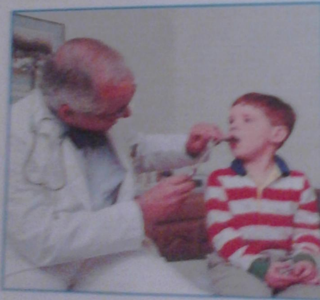
Право на медицинское обслуживание