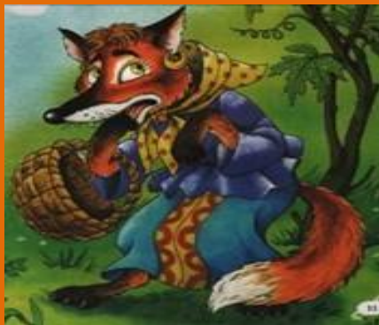
Лиса и дрозд