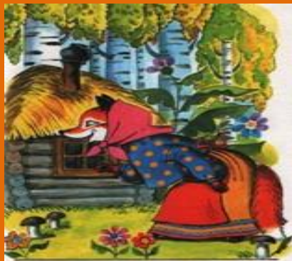
Кот и лиса