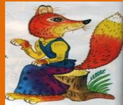
Лиса и журавль