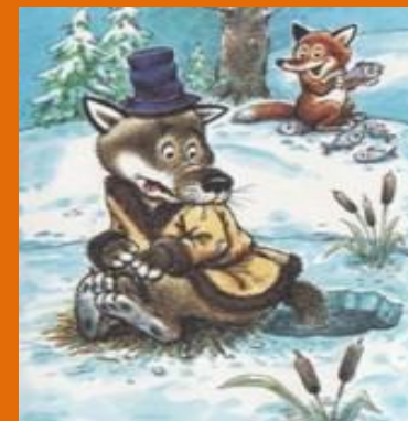
Лиса и волк