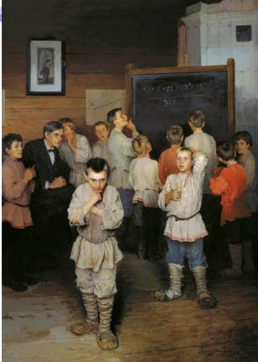
Н. П. Богданов - Бельский. «Устный счёт».