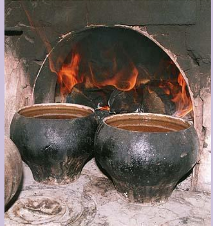
Из чугуна выплавляли чугунки.