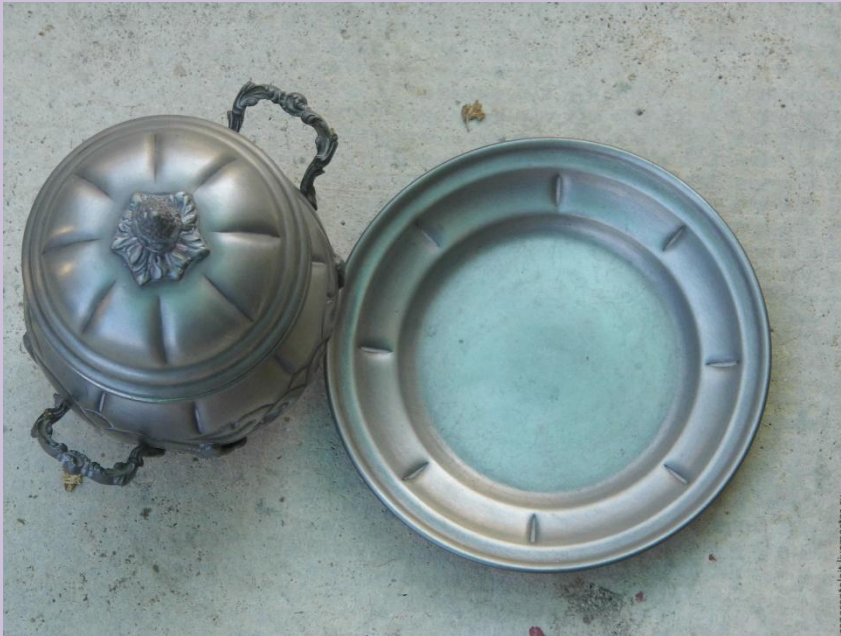
Посуда из олова

Потом появилась металлическая посуда –из олова, чугуна. Ими пользуются и в наше время. Как вы думаете, где и когда ?