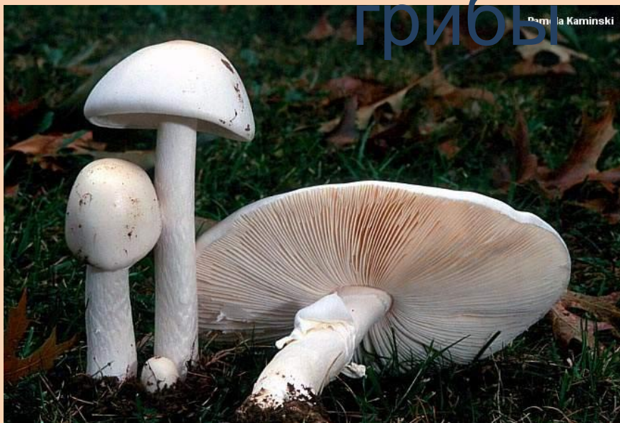
Мухомор вонючий или белая поганка