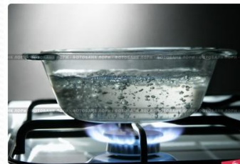
Стеклянная посуда на огне