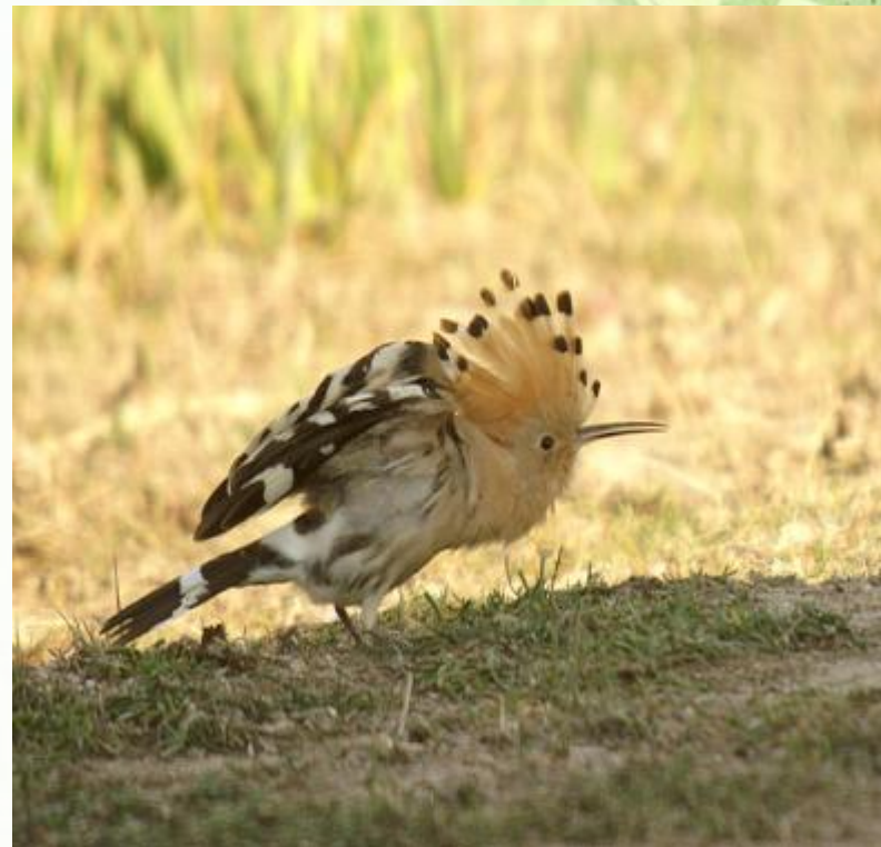
Возмущенный удод.

Характерной особенностью удода является хохолок на темени. Обычно он сложен, но когда эта птица чем-нибудь напугана или нервничает, она распахивает его в виде веера.