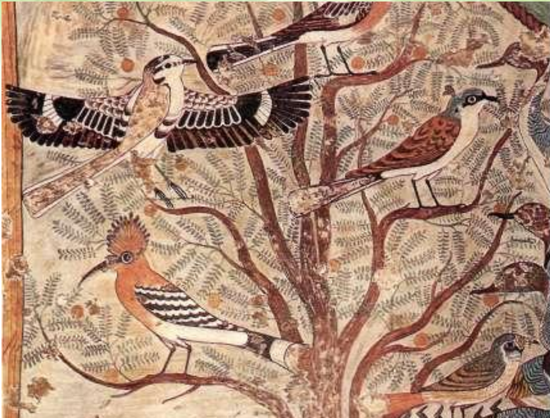
Деталь росписи гробницы Хнумхотепа в Бени-Гасане .