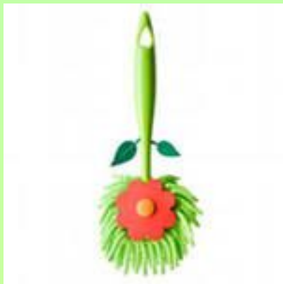
Щетка или кисть для удаления пыли