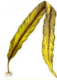
ЛАМИНАРИЯ (МОРСКАЯ КАПУСТА)