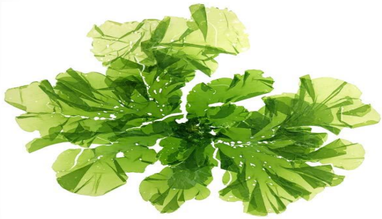
УЛЬВА (МОРСКОЙ САЛАТ)