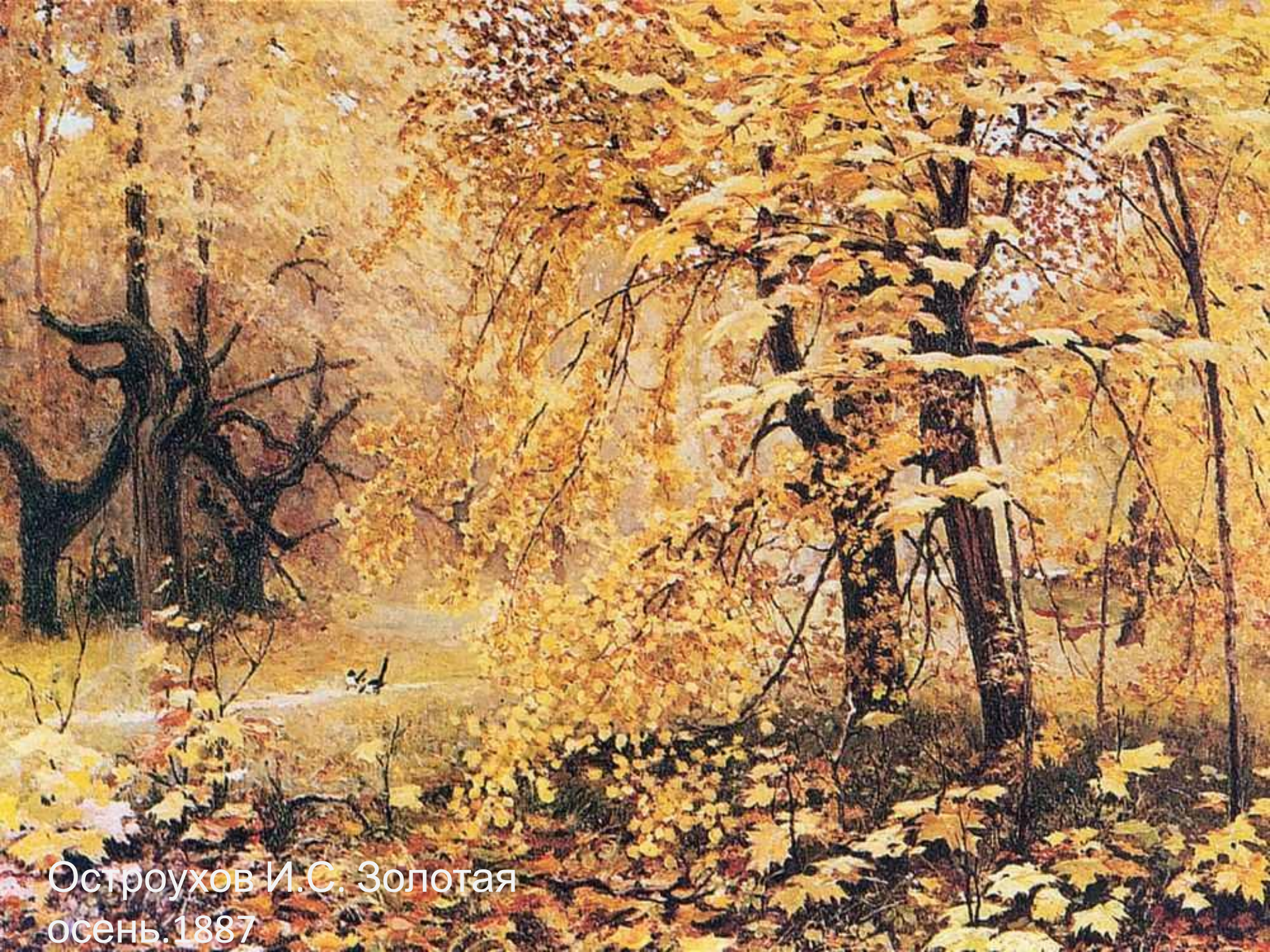
Остроухов И.С. Золотая осень. 1887