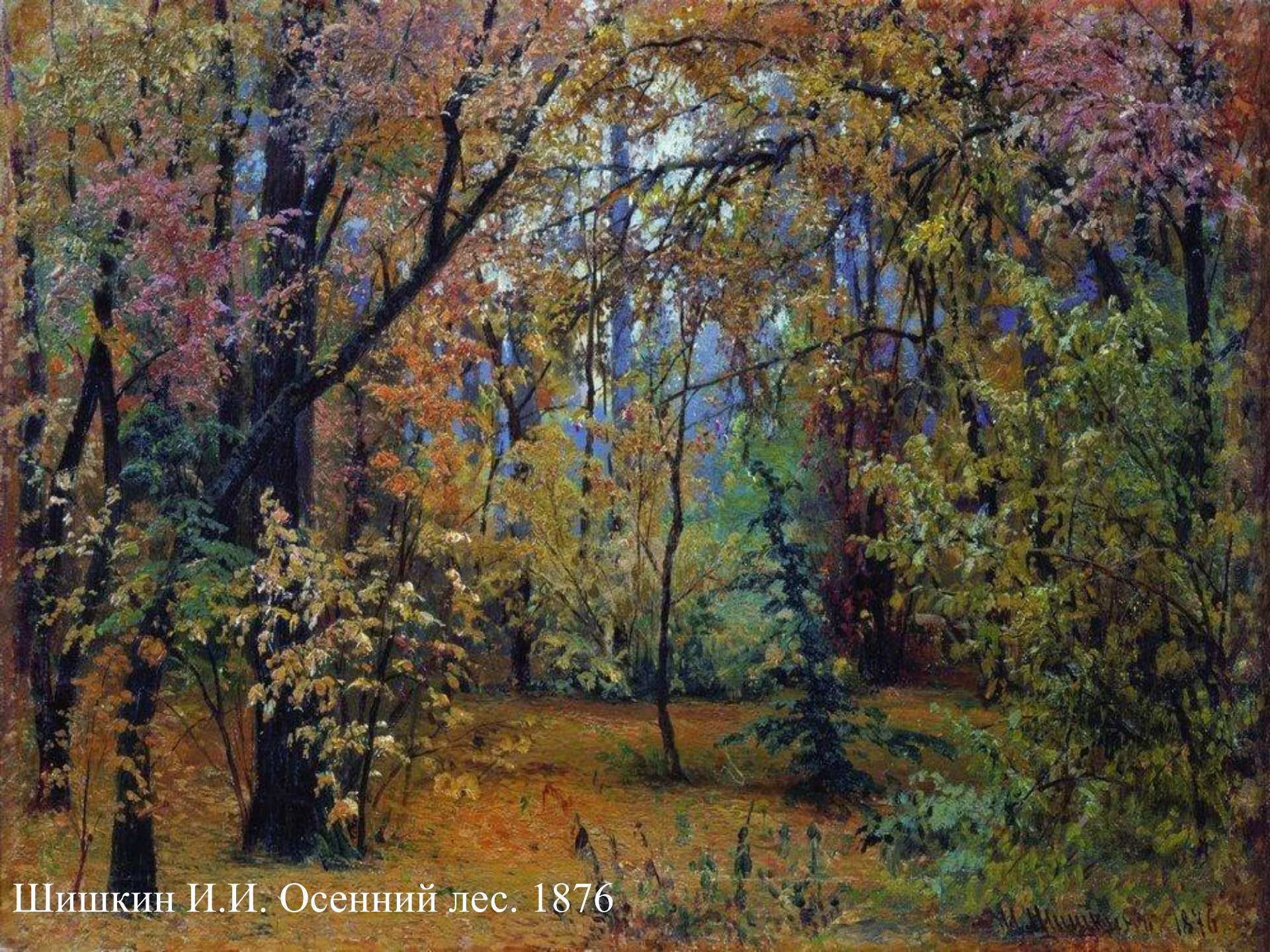
Шишкин И.И. Осенний лес. 1876