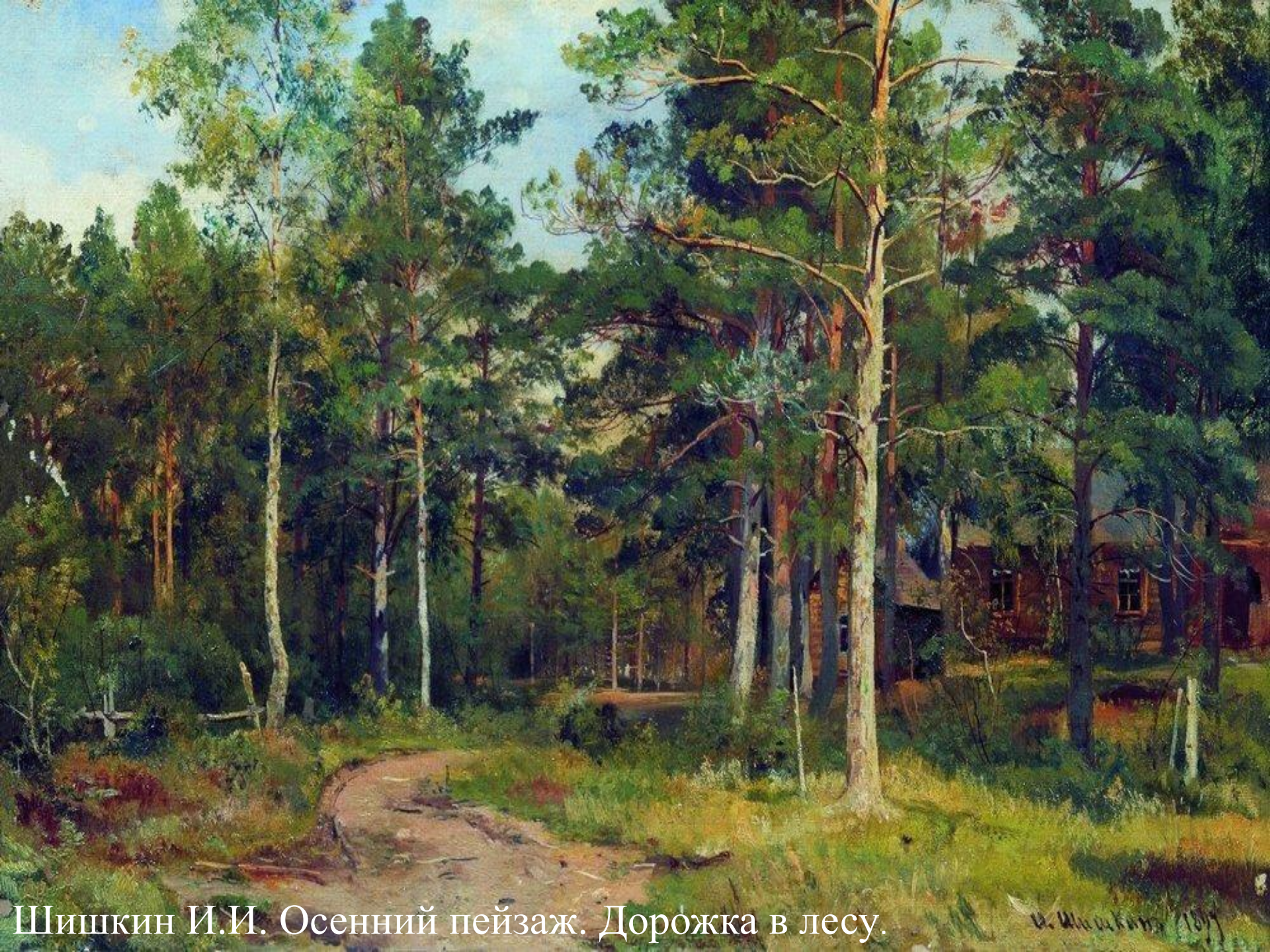
Шишкин И.И. Осенний пейзаж. Дорожка в лесу.