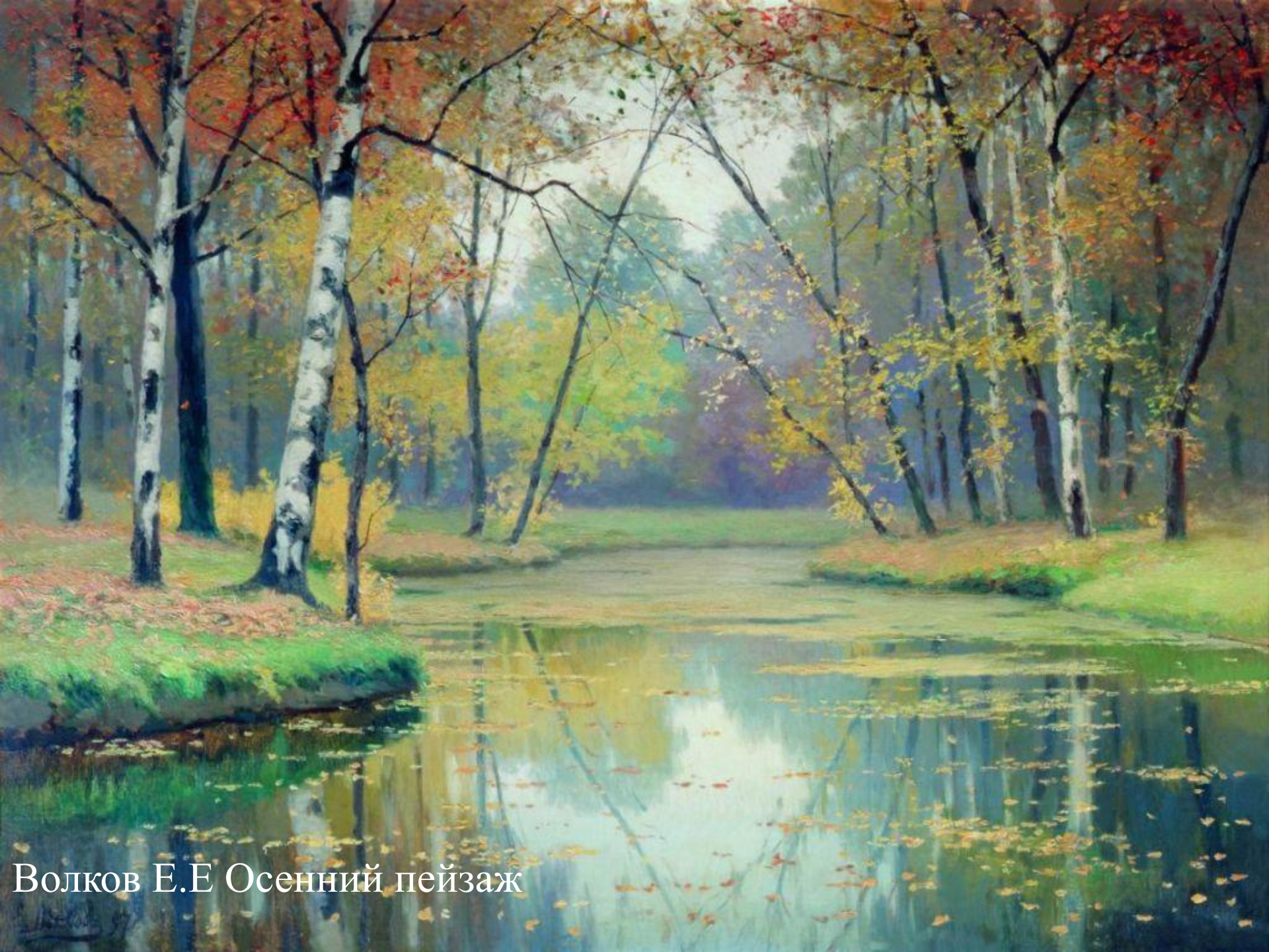
Волков Е.Е Осенний пейзаж