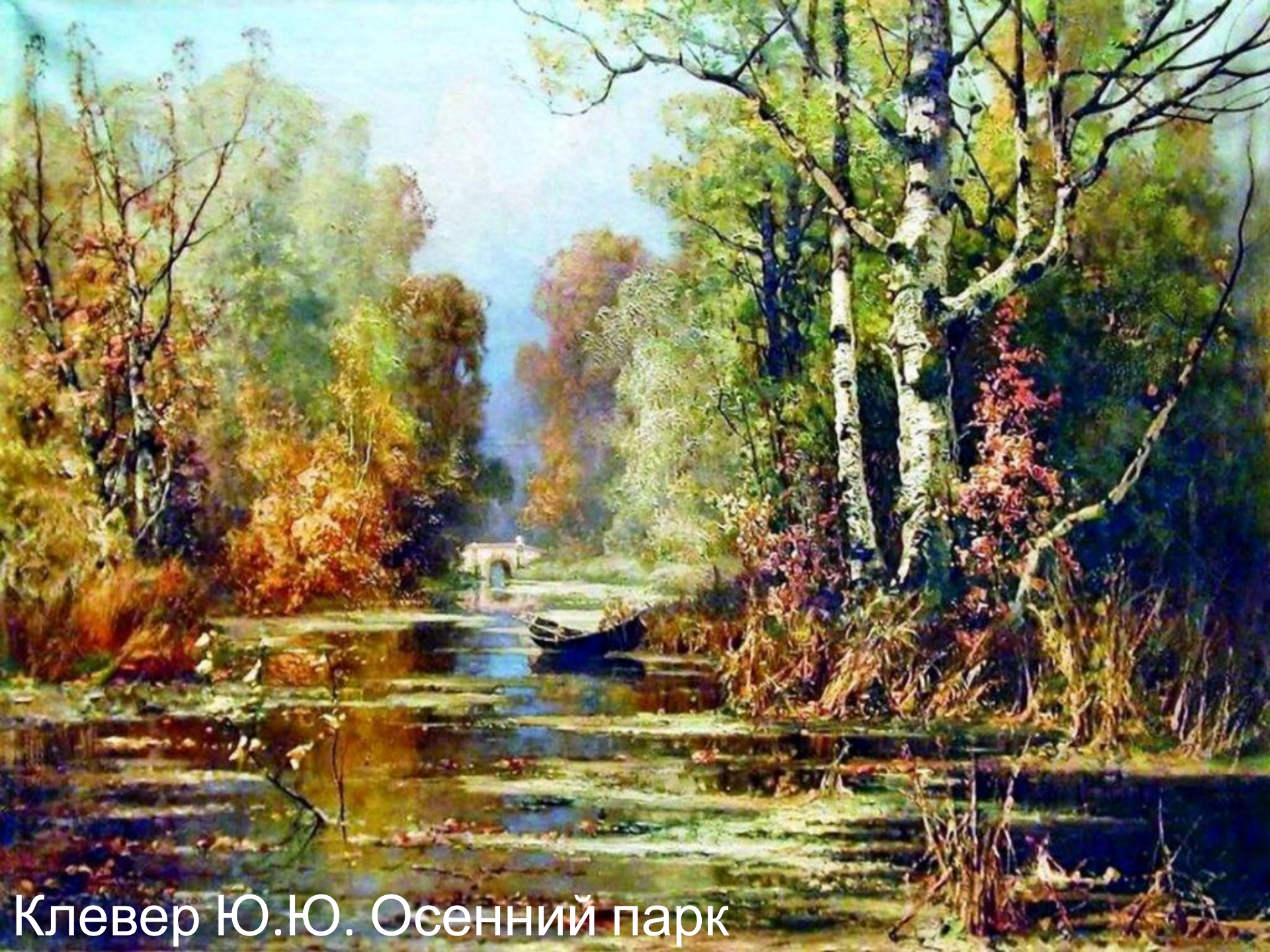
Клевер Ю.Ю. Осенний парк