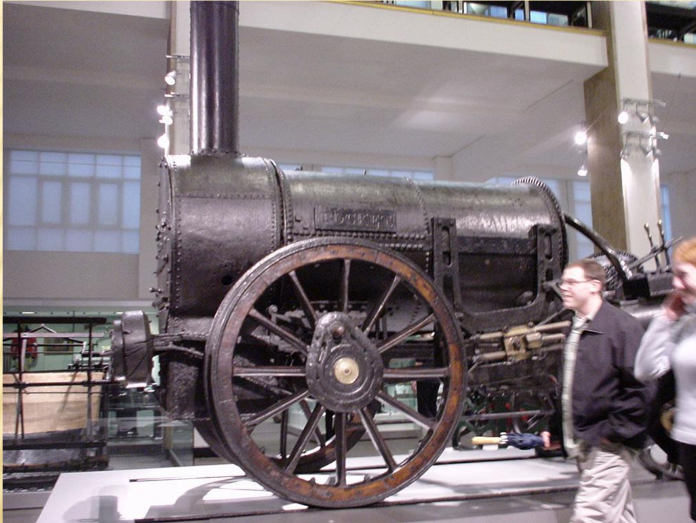
Первый паровоз Стивенсона