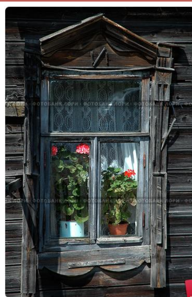
Окно деревенского дома

Чтобы сберечь тепло в избе, окна делали небольшими, из бычьего пузыря или кусочков полупрозрачной слюды. Как вы думаете, в доме было светло?