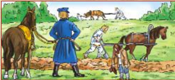
Крепостные крестьяне в российской деревне.

Особый порядок, который существовал во времена Российской империи. При крепостном праве крестьяне полностью подчинялись своим хозяевам — дворянам. Крепостных крестьян дворяне могли продавать, дарить и жестоко наказывать, а крестьяне не могли по своему желанию уходить от хозяев.