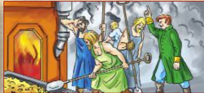
Крепостные рабочие на российском заводе.

Характер труда был ручной и подневольный.