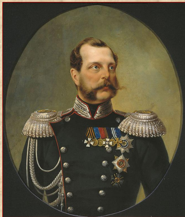
Император Александр II (освободитель)

Крепостное право в России было отменено. Несмотря на то, что положение большинства крестьян оставалось тяжёлым, многие из них смогли уйти из деревень в города, на промышленные предприятия в поисках заработка. Так стал образовываться рабочий класс.