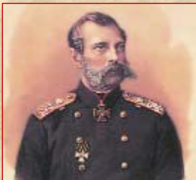
Император Александр II

Каким образом в современном мире люди и грузы перевозятся на большие расстояния?