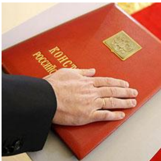
Специальный экземпляр Конституции Российской Федерации