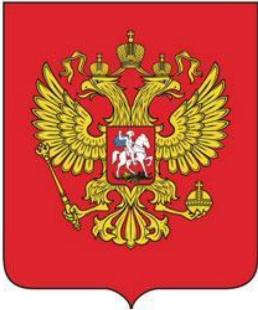
Государственный герб Российской Федерации

Герб является официальным государственным символом наравне с флагом и гимном. Герб Российской Федерации был изменен Указом Президента Бориса Николаевича Ельцина 30 ноября 1993 года.