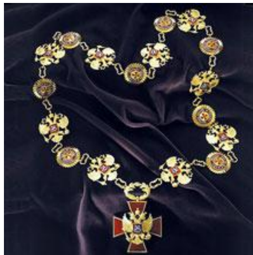
Знак Президента Российской Федерации