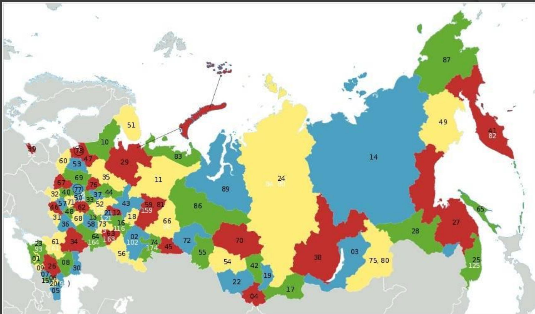
Субъекты Российской Федерации