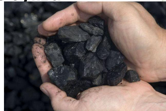
Цвет, 1 буква