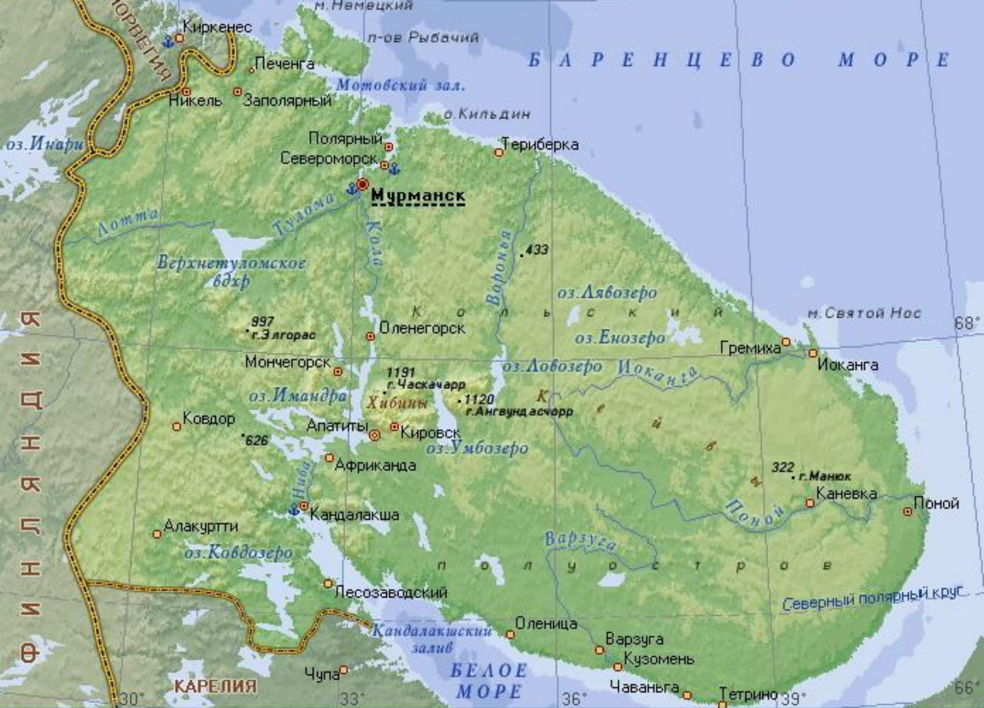
0 50 100 200 км МУРМАНСКАЯ ОБЛАСТЬ