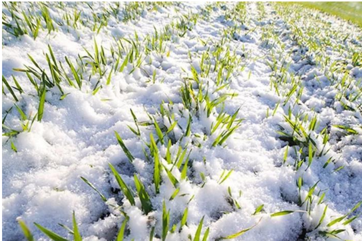
Озимая пшеница под снегом

Некоторые травянистые растения зимуют под снегом. Снег для них — как тёплое одеяло. Он надёжно укрывает и защищает от холода зелёные побеги злаков, земляники, копытня и других растений.