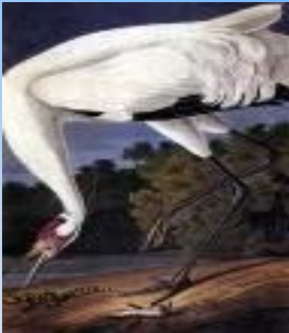
американский белый журавль