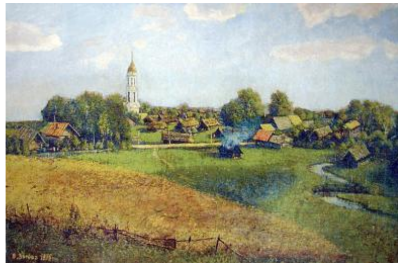
Мытищи, Ярославское шоссе, Церковь Иконы Божией Матери Владимирская