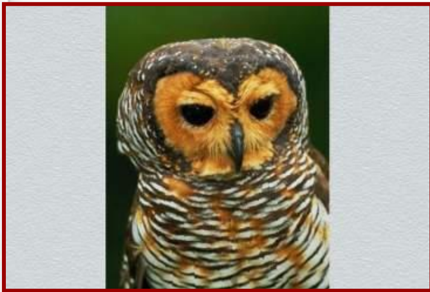
Сова – лесной хищник