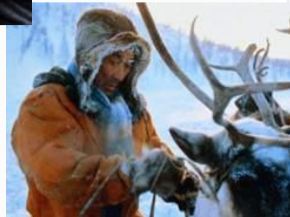
Житель Крайнего Севера