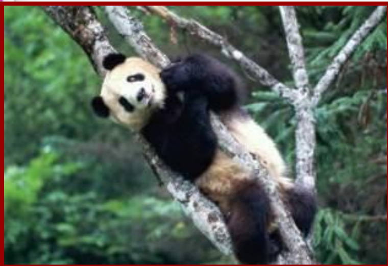
Панда, ее еще называют бамбуковым медведем.