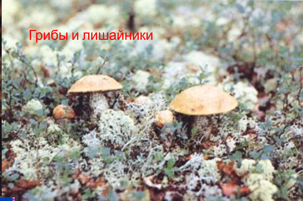
Грибы и лишайники