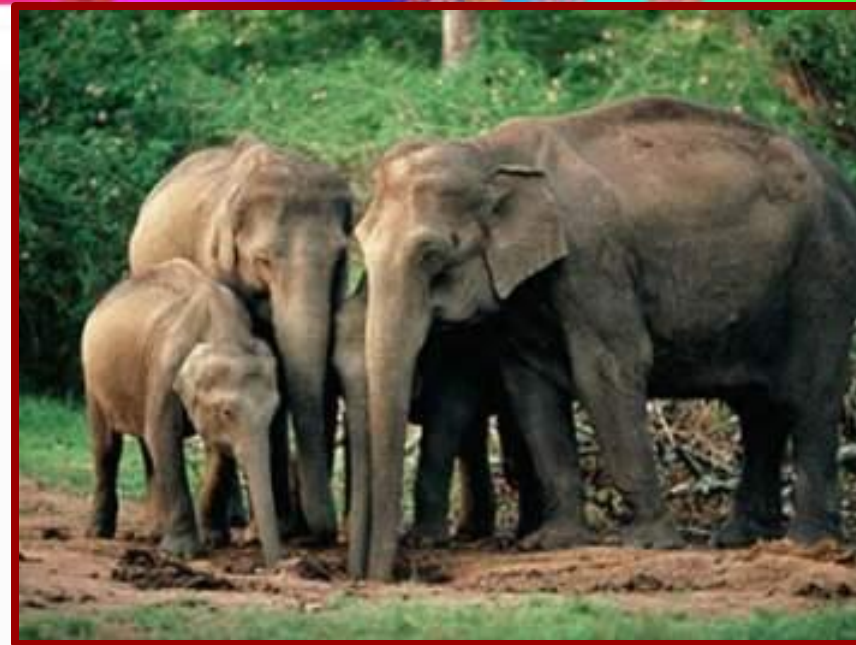
Семья индийских слонов