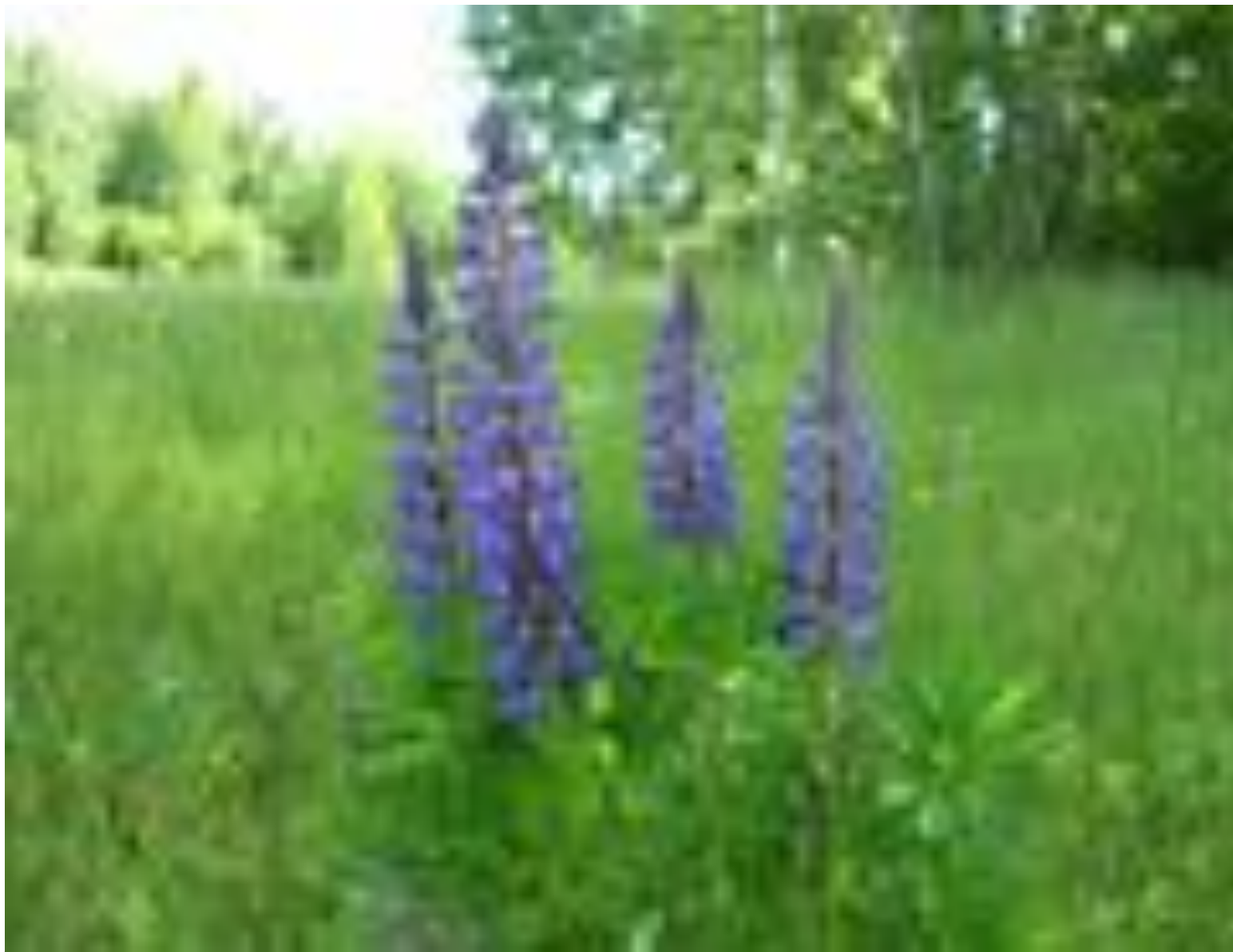
ЛЮ П И Н М Н О Г О Л И С Т Ы Й