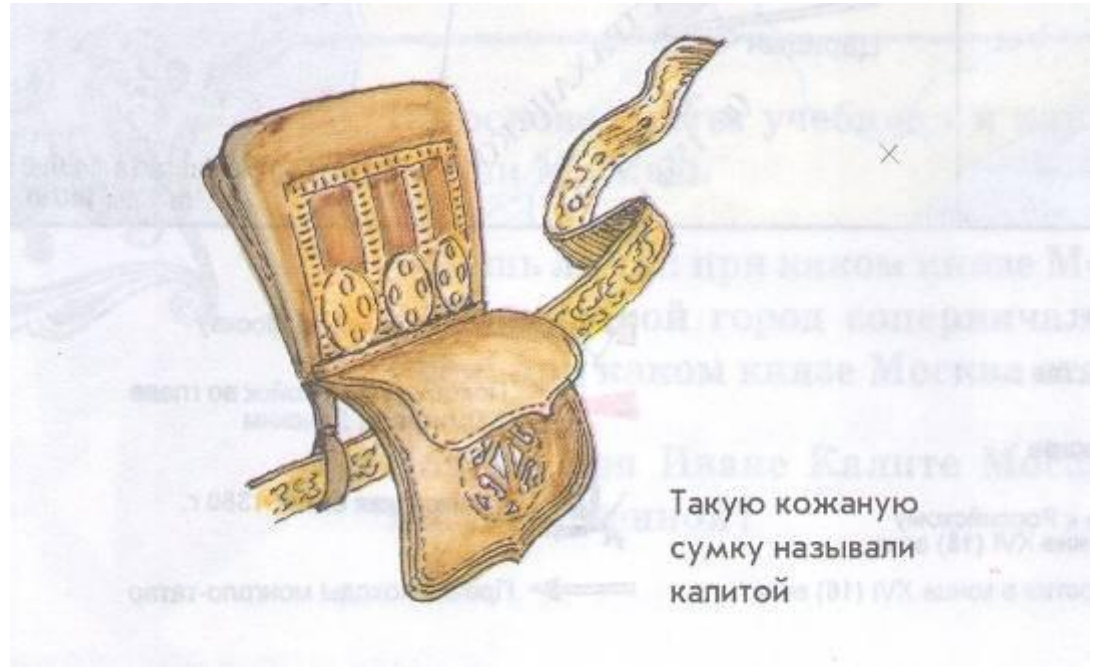
Такую кожаную сумку называли калитой