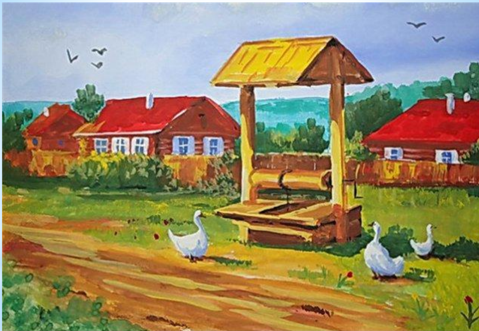
Рисунок Антона Григорьева (12 лет) “У колодца”