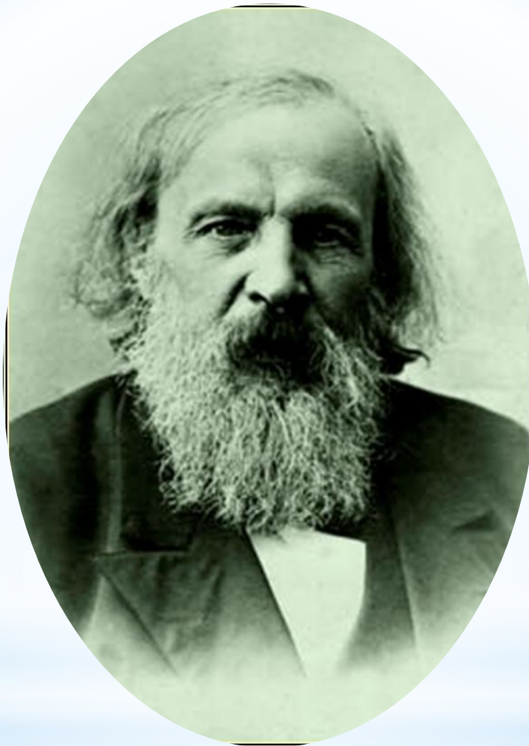
Дмитрий Иванович Менделеев