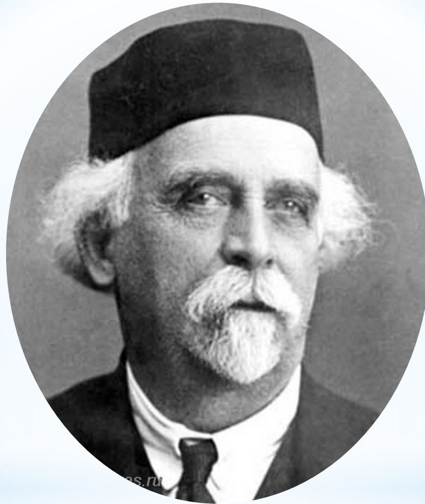
Николай Дмитриевич Зелинский