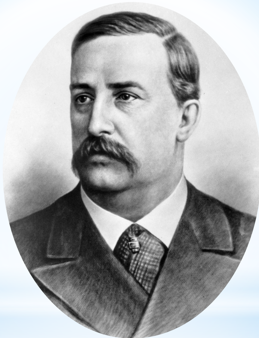
Александр Порфирьевич Бородин