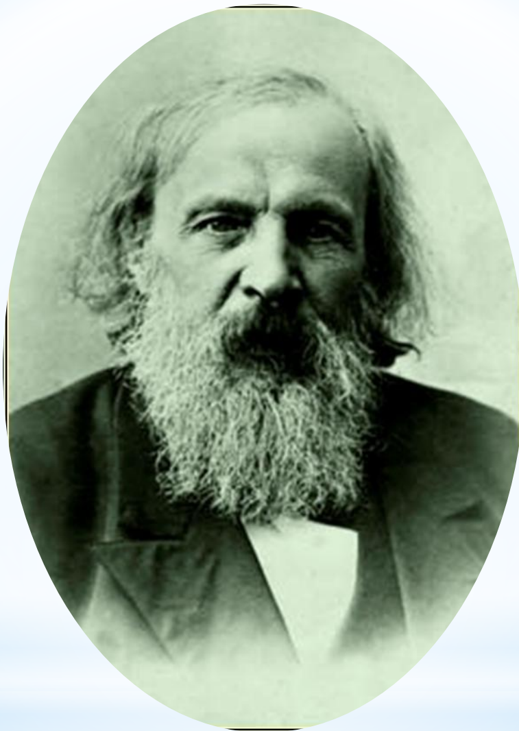
Дмитрий Иванович Менделеев