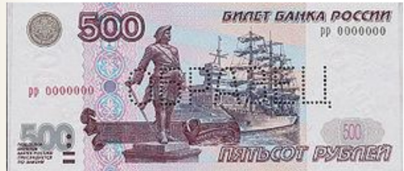
Памятник Петру I в Архангельске на современном билете Банка России