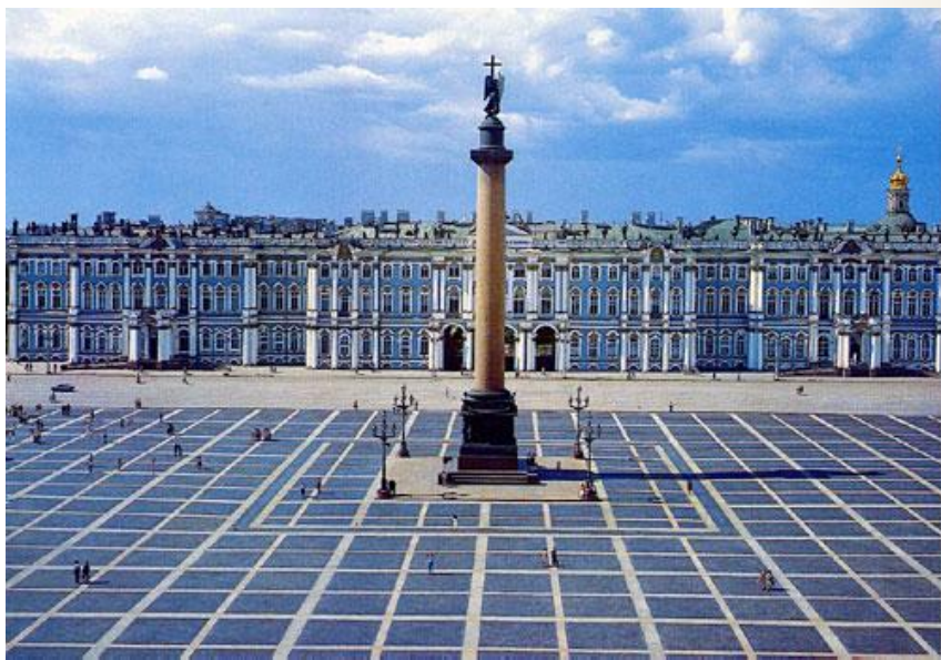
Зимний дворец – резиденция русских царей