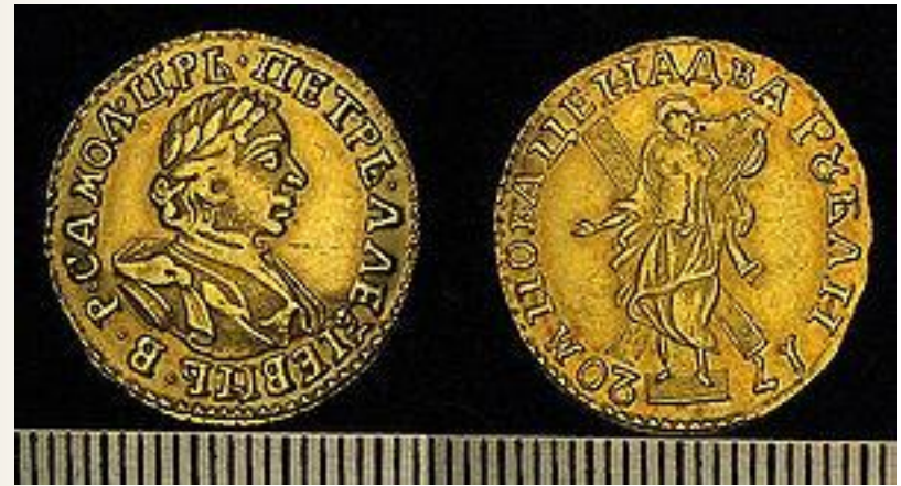
Два рубля ЗОЛОТОМ с профилем Петра. 1720