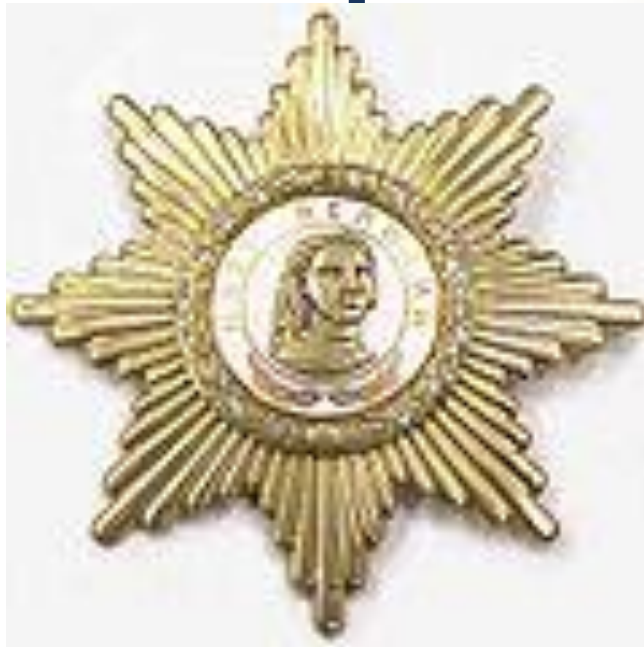
Орден Петра Великого