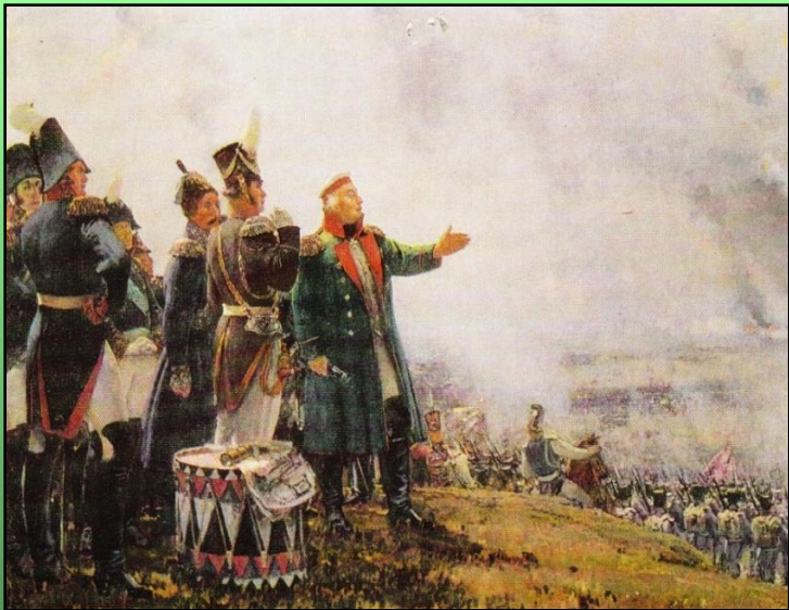
Кутузов на Бородинском поле