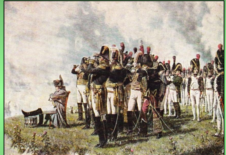
Наполеон на Бородинских высотах