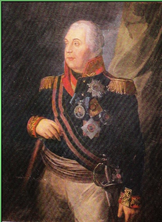
Михаил Илларионович Кутузов (1745-1813)