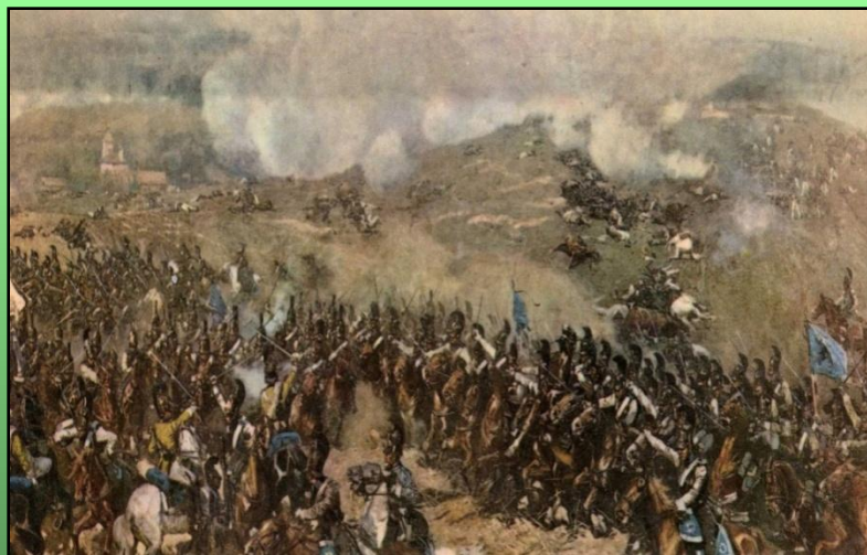
Бой у Курганной высоты