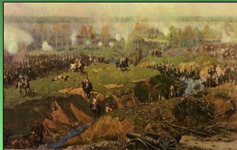
Бой у Семёновского оврага