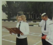
ИНСПЕКТОР ПОЖАРНОЙ ОХРАНЫ