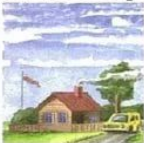
Слабый 3 (4–5 м/с)