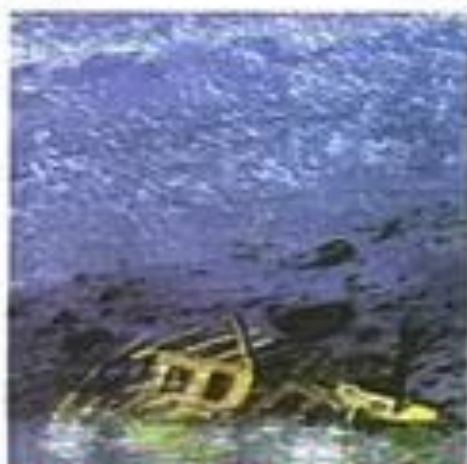
Ураган 12 ( > 20 м/с)