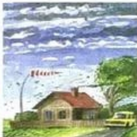
Сильный 6 (11–12 м/с)