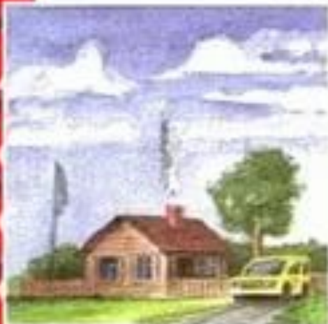
Штиль 0 ( < 1 м/с)