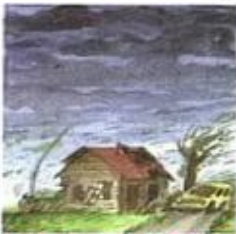
Шторм 9 (10–22 м/с)