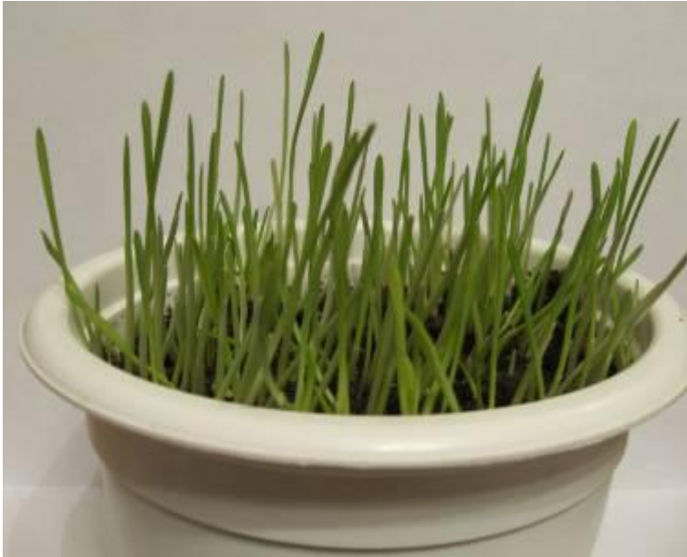
Семена овса, проращенные в темноте