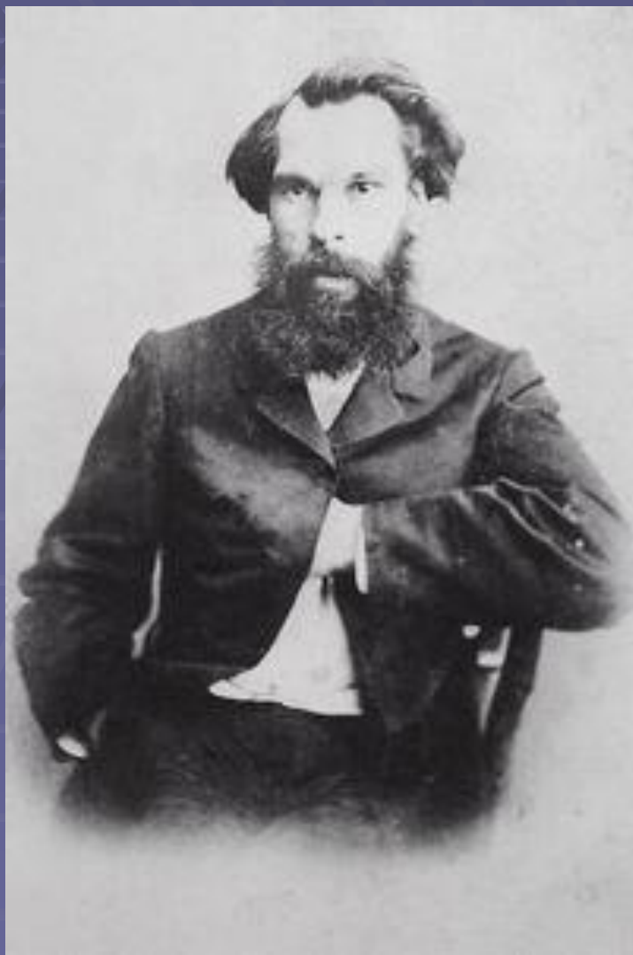
Алексей Саврасов, 1865