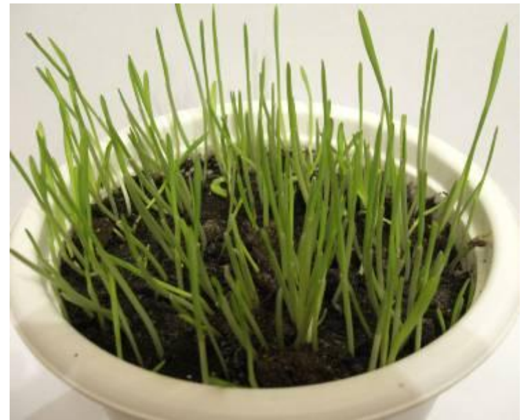
Семена овса, проращенные на свету