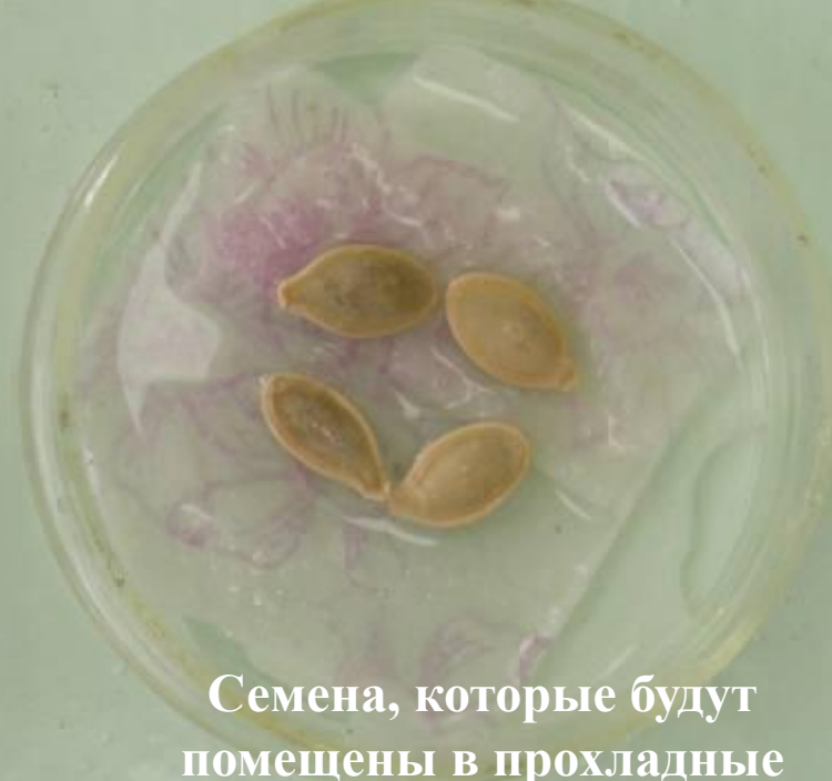
Семена, которые будут помещены в прохладные условия