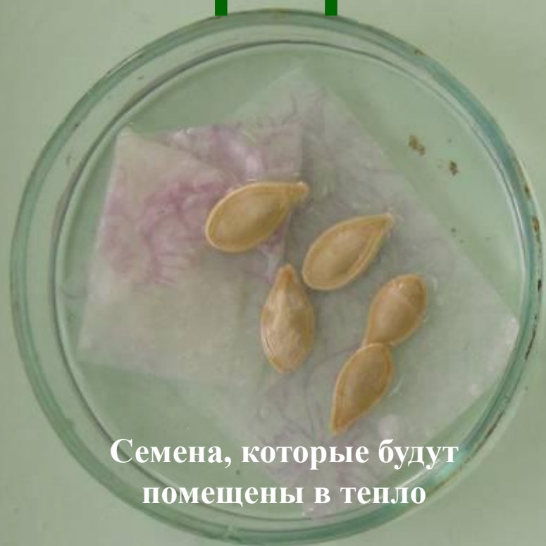
Семена, которые будут помещены в тепло