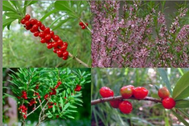
Волчье лыко (волчья ягода)