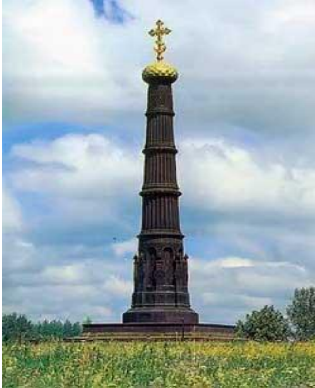
Куликово поле, монумент героям Куликовской битвы