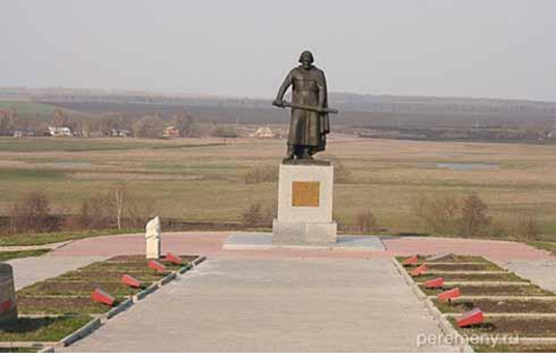
Памятник Дмитрию Донскому на месте Куликовской битвы