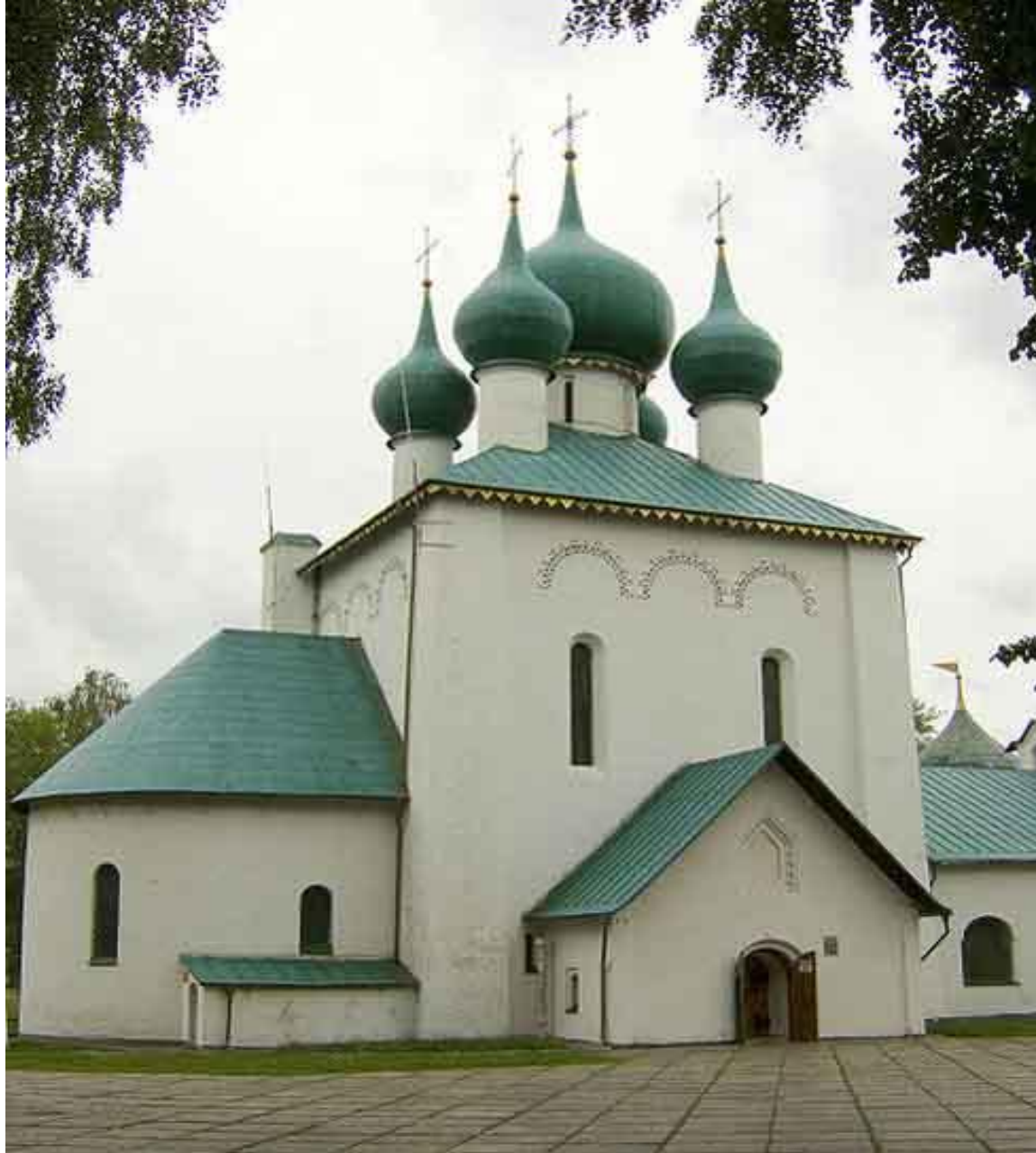
Храм Сергия Радонежского, увековечивший память героев Куликовской битвы