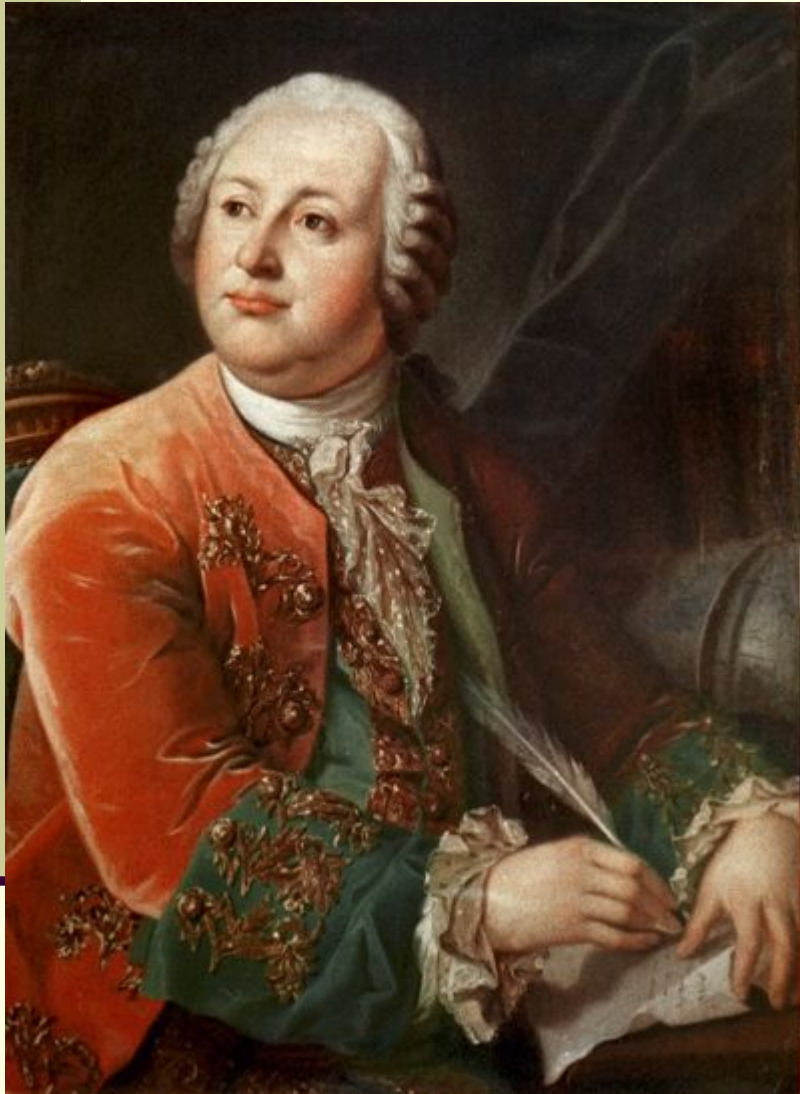
Михаил Васильевич Ломоносов (1711 - 1765)