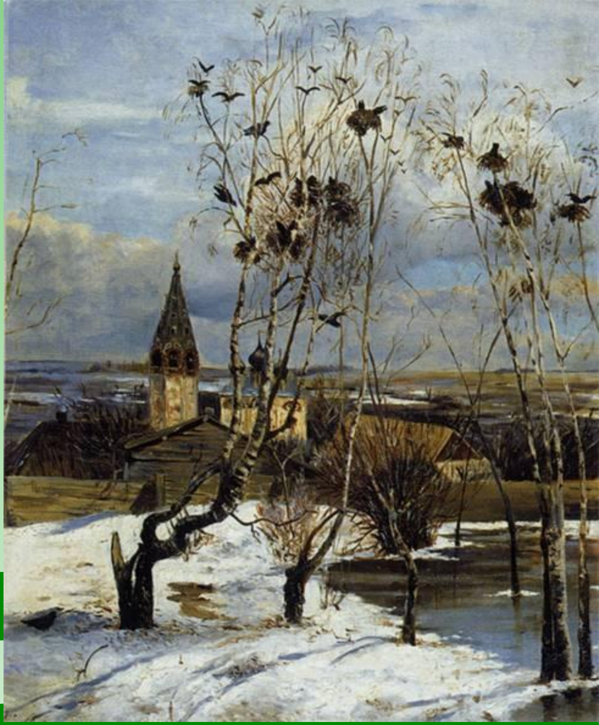
А.К. Саврасов «Грачи прилетели»