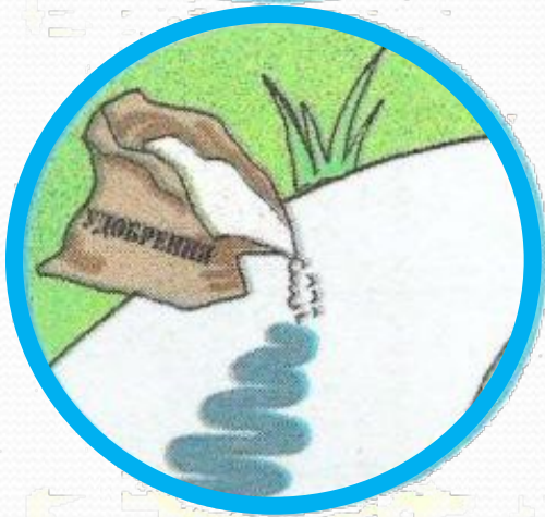
Удобрения и ядохимикаты