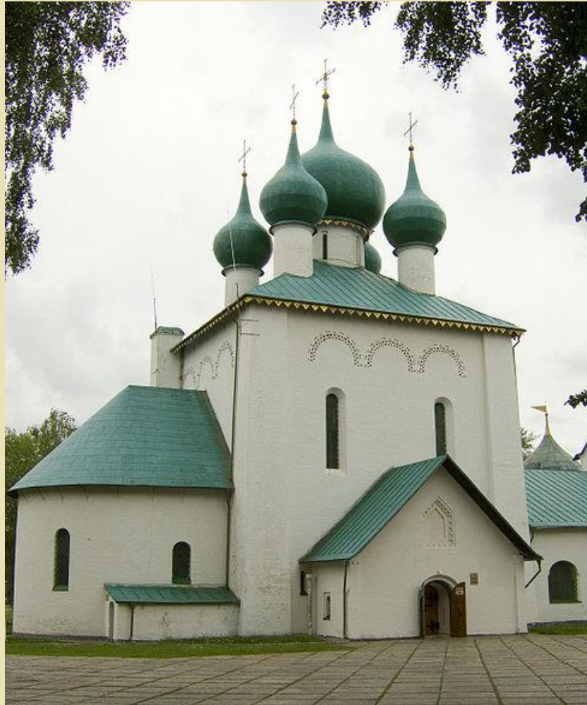
Храм Сергия Радонежского