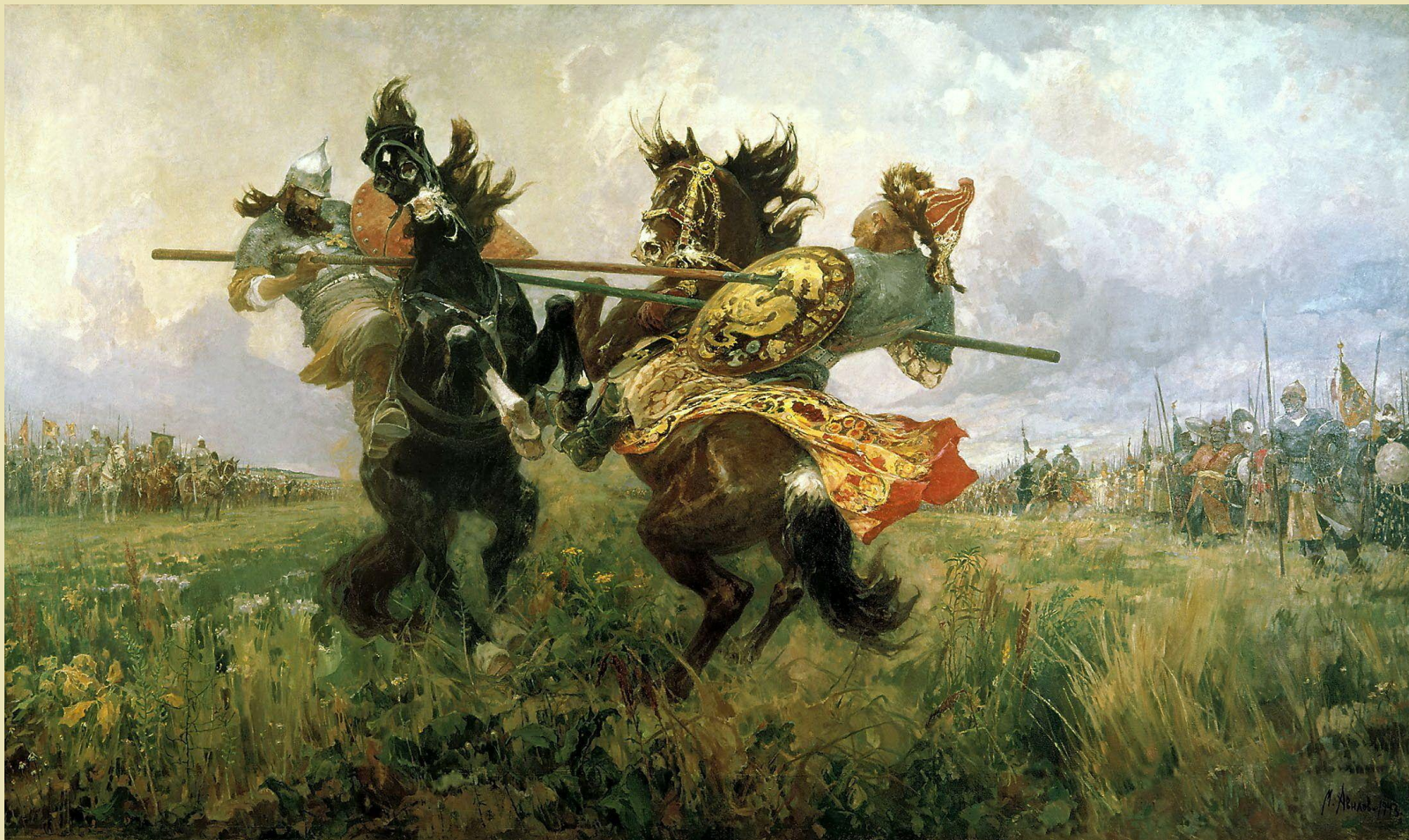
В.Васнецов «Поединок Пересвета с Челубеем»