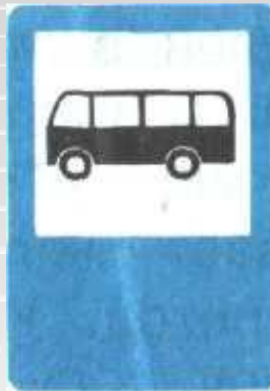
место остановки автобуса и троллейбуса